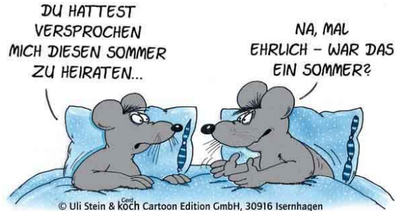
© Uli Stein & Köch Cartoon Edition GmbH, 30916 Isernhagen

Wer einen Salat oder ähnliches mitbringen möchte, sage uns doch bitte kurz Bescheid. Für mitgebrachtes und bei uns